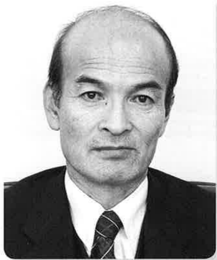
広尾町農業協同組合代表理事組合長