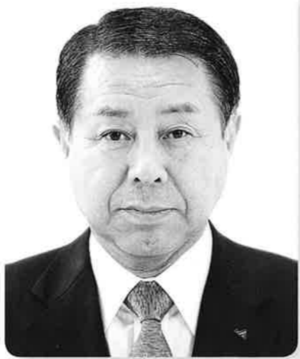
北海道農業協同組合中央会会長