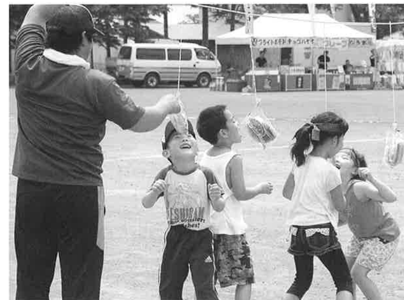
食欲の夏「元気な子」

運動会終了後には、親睦交流会が行われ、名物の肉牛部会による牛の丸焼きに舌鼓を打ち、また各種ゲームで盛り上がり参加者全員が、日頃の疲れを癒し楽しむことができた1日となりました。