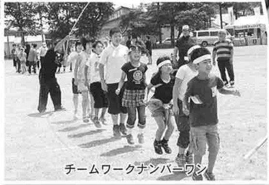
チームワークナンバーワン