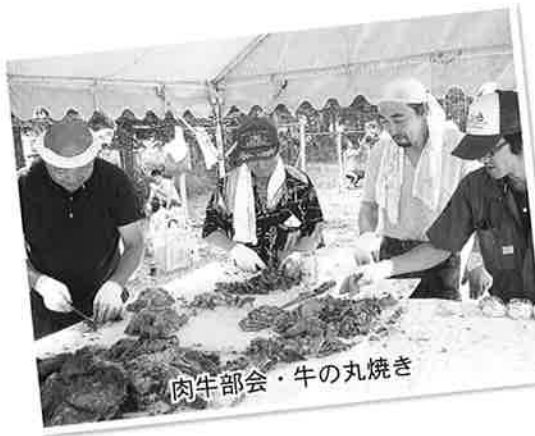
肉牛部会・牛の丸焼き